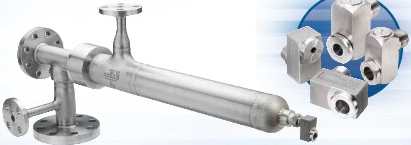
ASME®是美国机械工程师协会的注册商标

硫酸喷射要求喷嘴能够产生细小，颗粒均匀的液滴，能够迅速蒸发，从而避免在炉内积聚。数十年来，BA WhirlJet液压喷嘴已成为行业的标准。这种内联式的喷嘴能够产生细小的液滴，并独具开放式通道以防止堵塞。流量范围从0.21gpm (0.79lpm) 到38gpm (144lpm)。硫酸喷枪可配备各种样式的喷嘴，适用于各种不同的长度和多种材质。该喷枪按照ASME B31.3-2010标准生产。